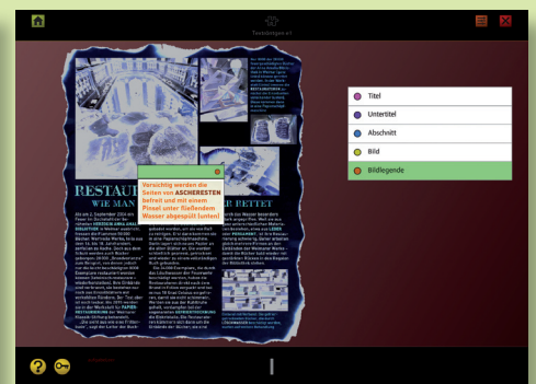
«Textröntgen»: Erkennen und nachvollziehen, wie ein Text strukturiert ist.