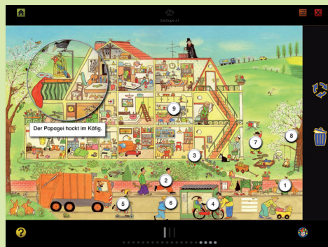
«Satzlupe»: Aussagen von Einzelsätzen detailgenau verstehen.

Die Software entlastet Lehrerinnen und Lehrer bei der Umsetzung eines adaptiven Lesetrainings und schlägt viele Brücken zum schulischen und auserschulischen Lesen.